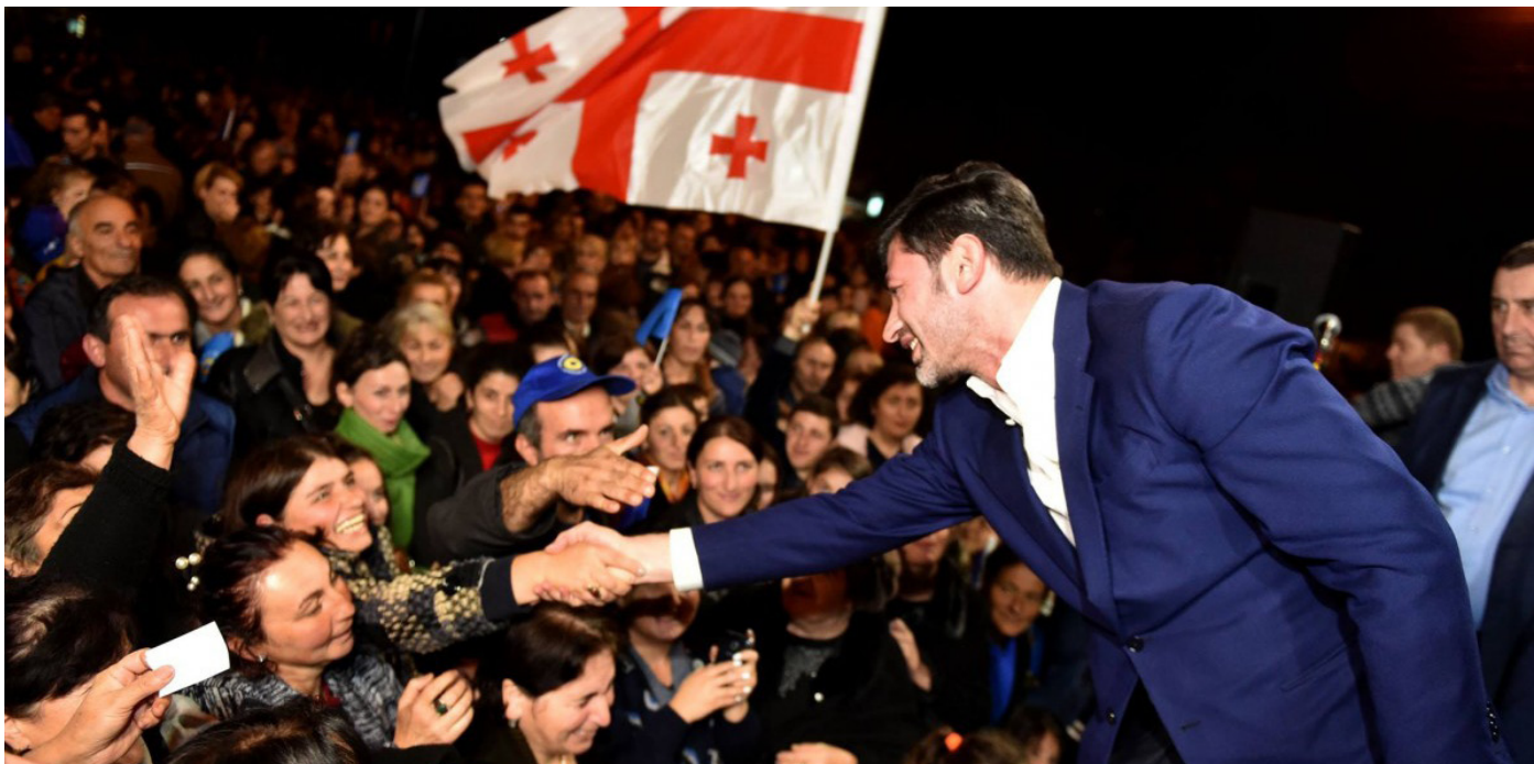
Каха Каладзе при внушительной финансовой, партийной и административной поддержке одержал победу в первом же туре выборов мэра Тбилиси.

Результаты октябрьских местных выборов показали слабость смешанной избирательной системы для грузинских реалий, фактически закрепив монополию одной партии на власть в регионах и запустив президентскую избирательную компанию. В то же время в мировых экономических рейтингах Грузия снова улучшила свои позиции. А на международной арене укрепляет отношения с европейскими партнерами.