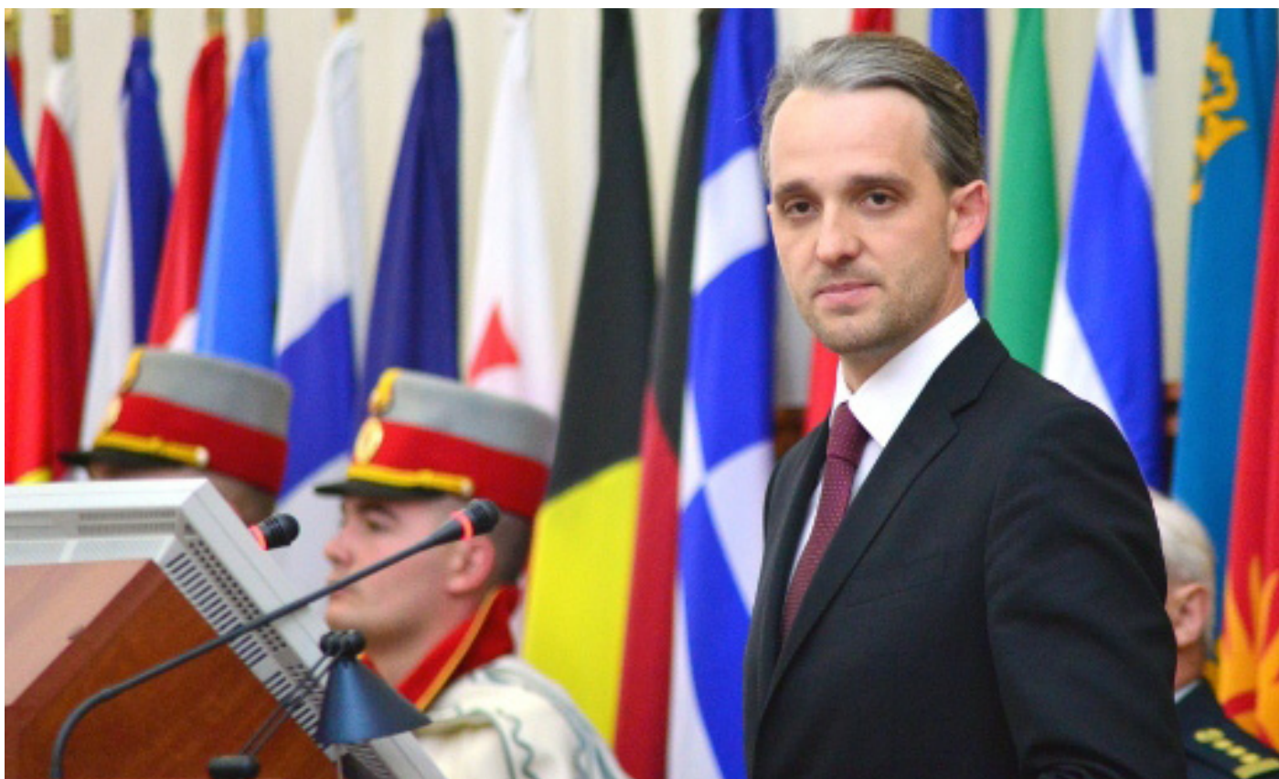
Назначение нового министра обороны Евгения Стурзы спровоцировало противостояние между президентом и спикером парламента.

На внутреннем уровне октябрь был отмечен очередным спорным прецедентом, возникшим после решения Конституционного суда в отношении институционального блокирования между президентом и правительством и парламентом. Дебаты во внешней политике сосредоточились на потенциальных результатах саммита Восточного партнерства, также Молдова горячо обсуждалась и в Европейском парламенте. Более того, молдавское правительство получило предупреждение о приостановке финансовых выплат в определенных сферах из-за недостаточной приверженности программе реформ.