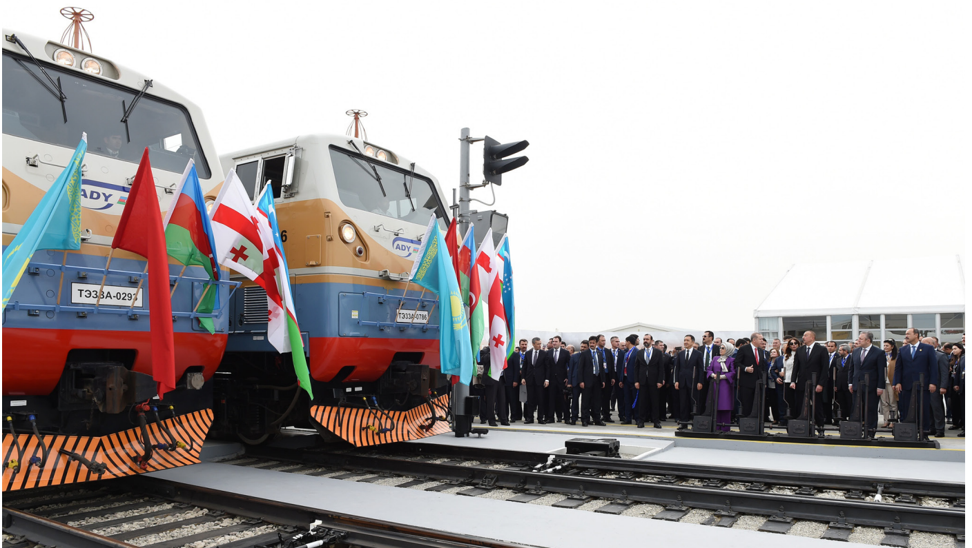
Церемония открытия железной дороги Баку – Тбилиси – Карс.

И вновь на повестке Азербайджана стоят вопросы защиты прав человека. С одной стороны, поправки, внесенные в законодательство страны, ограничи-ли гражданских активистов при выборе уполномоченных представителей в суде. С другой стороны, данный вопрос стал причиной новой волны напряжения в отношениях с европейскими партнерами.