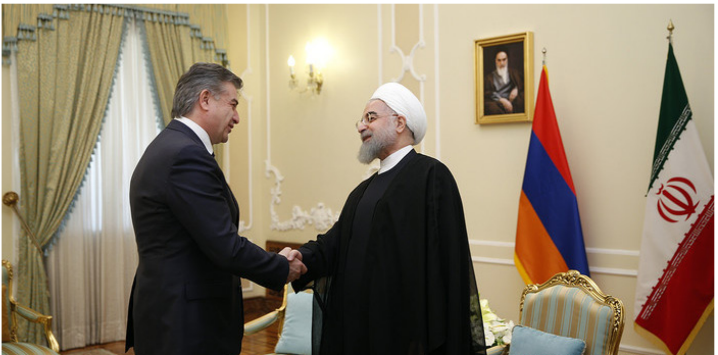
Премьер-министр Армении Карен Карапетян встретился с президентом Ирана Хуссаном Рухани.

Встреча на высшем уровне между президентами Армении и Азербайджана в Женеве ознаменовала важную, однако все еще осторожную попытку возобновить дипломатический процесс в связи с конфликтом в Нагорном Карабахе. В то же время события в самой Армении, включая отмену отсрочки призыва в армию и запланированное повышение расходов на оборону, еще раз подчеркивают гораздо более взвешенный подход властей. Вместе с тем возросло напряжение из-за стремительного роста цен на ключевые товары потребления и основные продукты питания. Хотя даже эти меры не смогли подкрепить слишком амбициозные и оптимистичные прогнозы армянского правительства по экономическому росту в 2018 году.