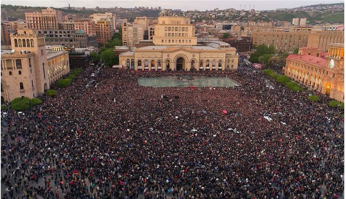
Мирные протесты на улицах Еревана против избрания Сержа Саркисяна премьер-министром.

В первом полугодии в центре внимания всей страны было завершение долгожданной трансформации президентско-парламентской республики в парламентскую. Согласно новой конституции, изменения должны были полностью завершиться до апреля 2018 года. Фактическим главой государства должен стать новоизбранный премьер, а пост президента станет символическим.