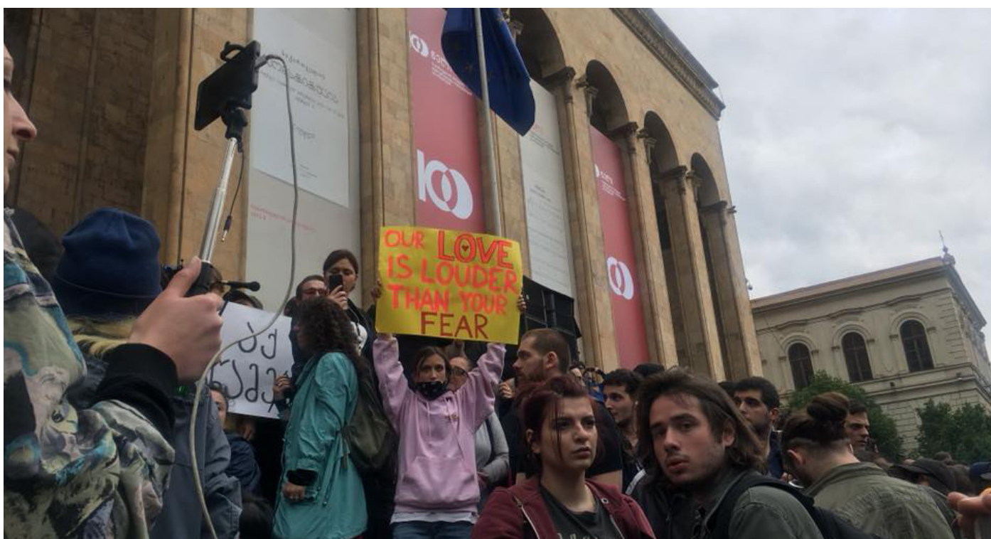
Уличные протесты против предвзятости расследования прокуратурой дела об убийстве двух школьников.

Первое полугодие 2018-го выдалось непростым для Грузии. Обстановка в стране была накалена до предела серией протестов, которые в итоге привели к отставке премьера. Перед новым правительством стоит целый ряд неотложных задач – от экономических реформ и реформы правосудия до евроатлантической интеграции страны.