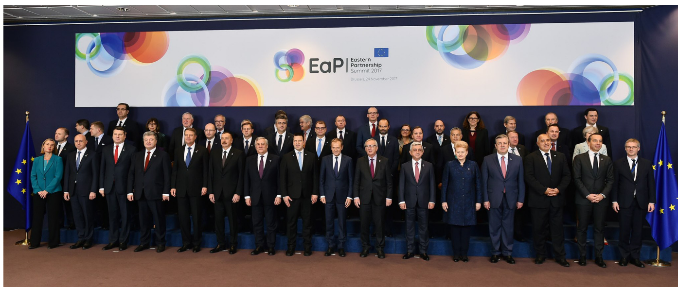
Пятый Саммит Восточного партнерства в декабре 2017 года принял Совместный рабочий документ «20 ожидаемых достижений до 2020 года»

Совместный рабочий документ «20 ожидаемых достижений до 2020 года» стал очередной попыткой задать векторы развития Восточного партнерства, которые опирались бы на реальный прогресс реформ и демократические преобразования в странах-партнерах при поддержке Евросоюза. По сути, общий план работы на ближайшие несколько лет дает понимание, каких реальных и осязаемых результатов ожидают стороны от сотрудничества. Какую же рамку задали политике Восточного партнерства?