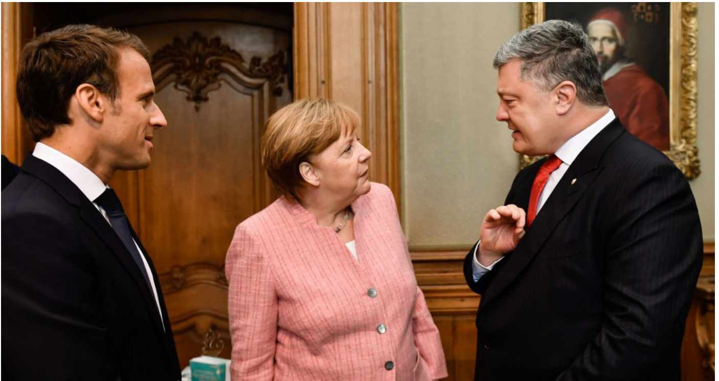
Встреча глав государств Нормандского формата в Аахене.

В первом полугодии 2018-го внутренняя политика Украины получила ярко выраженный предвыборный окрас. Вместе с тем во внешней политике наметилась позитивная динамика в отношениях с ЕС, в частности с Германией. А в отношениях с Россией сохраняется конфликтность, боевики на востоке игнорируют режим перемирия.