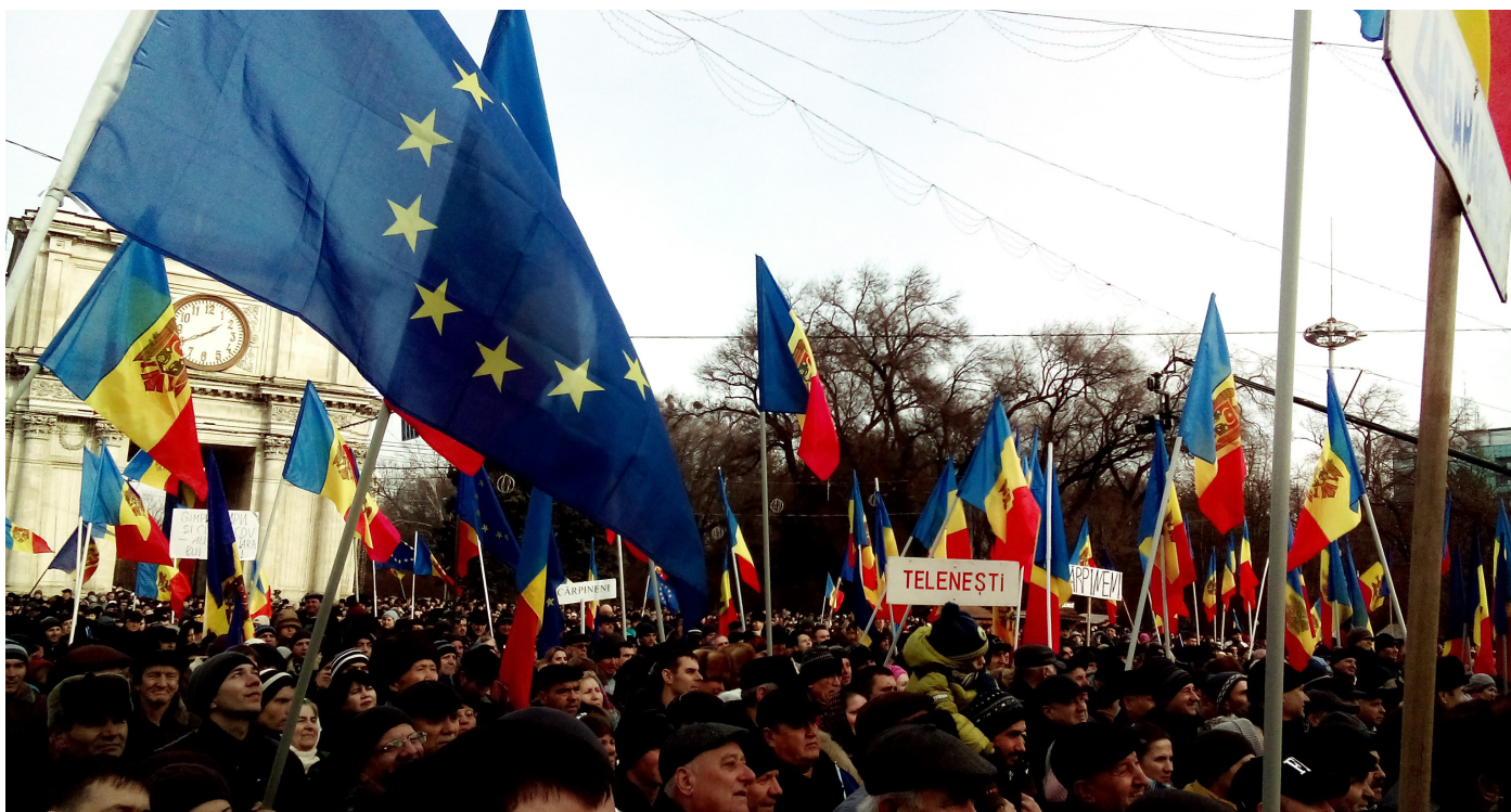
Улицы Кишинёва протестуют против решения Верховного суда аннулировать выборы мэра столицы.

В первой половине 2018 года в Республике Молдова уровень демократии неуклонно снижался – в стране не соблюдались фундаментальные права человека и нарушались принципы верховенства права. Отмечая четырехлетие подписания Соглашения об ассоциации, Молдова подводит неутешительные итоги: системные реформы так и не проводятся, а партнеры постоянно выражают обеспокоенность ситуацией в стране. Решение Верховного суда Молдовы аннулировать результаты выборов мэра Кишинева не только подтвердило отсутствие прозрачной и независимой судебной системы в стране, но и усилило восприятие Молдовы как страны, где частные интересы определяют политику государства.