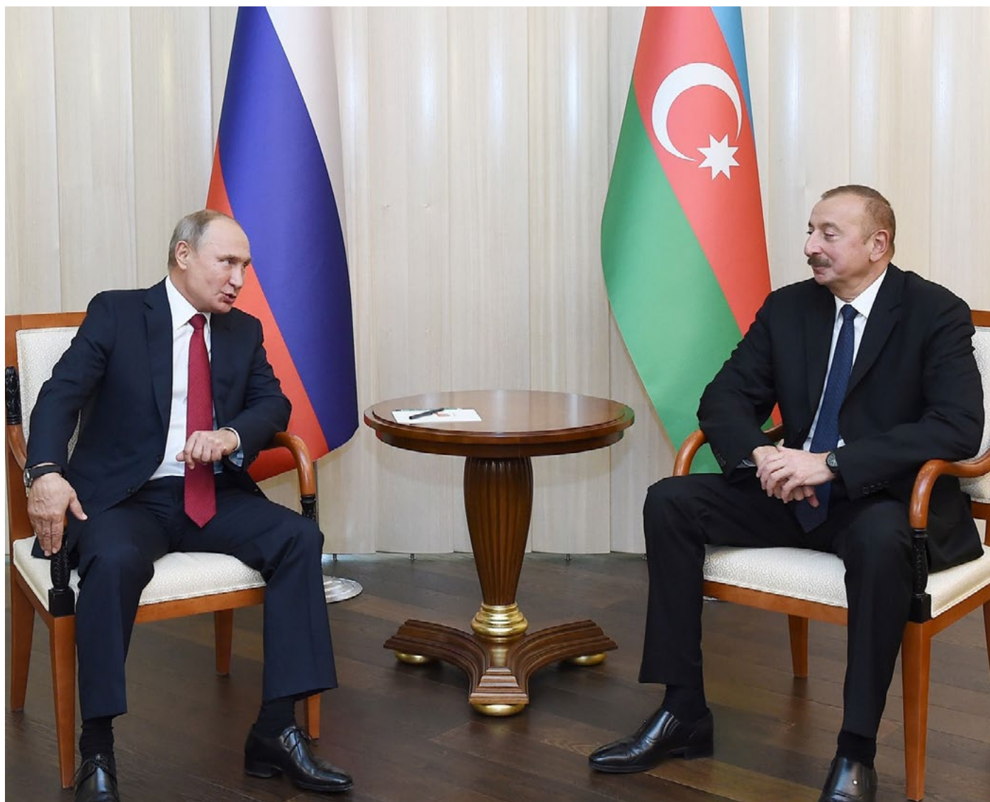
Президенты Азербайджана и России обменялись официальными визитами.

Решение Конституционного суда касательно долларовых кредитов, выданных до девальвации маната, вызвало негодование отчаявшихся заемщиков. В это же время во внешней политике страны основные события были связаны с взаимными визитами азербайджанского и российского лидеров. Более того, интерес России к финансированию различных проектов в Азербайджане послужил доказательством того, что страну рассматривают как важного экономического партнера.