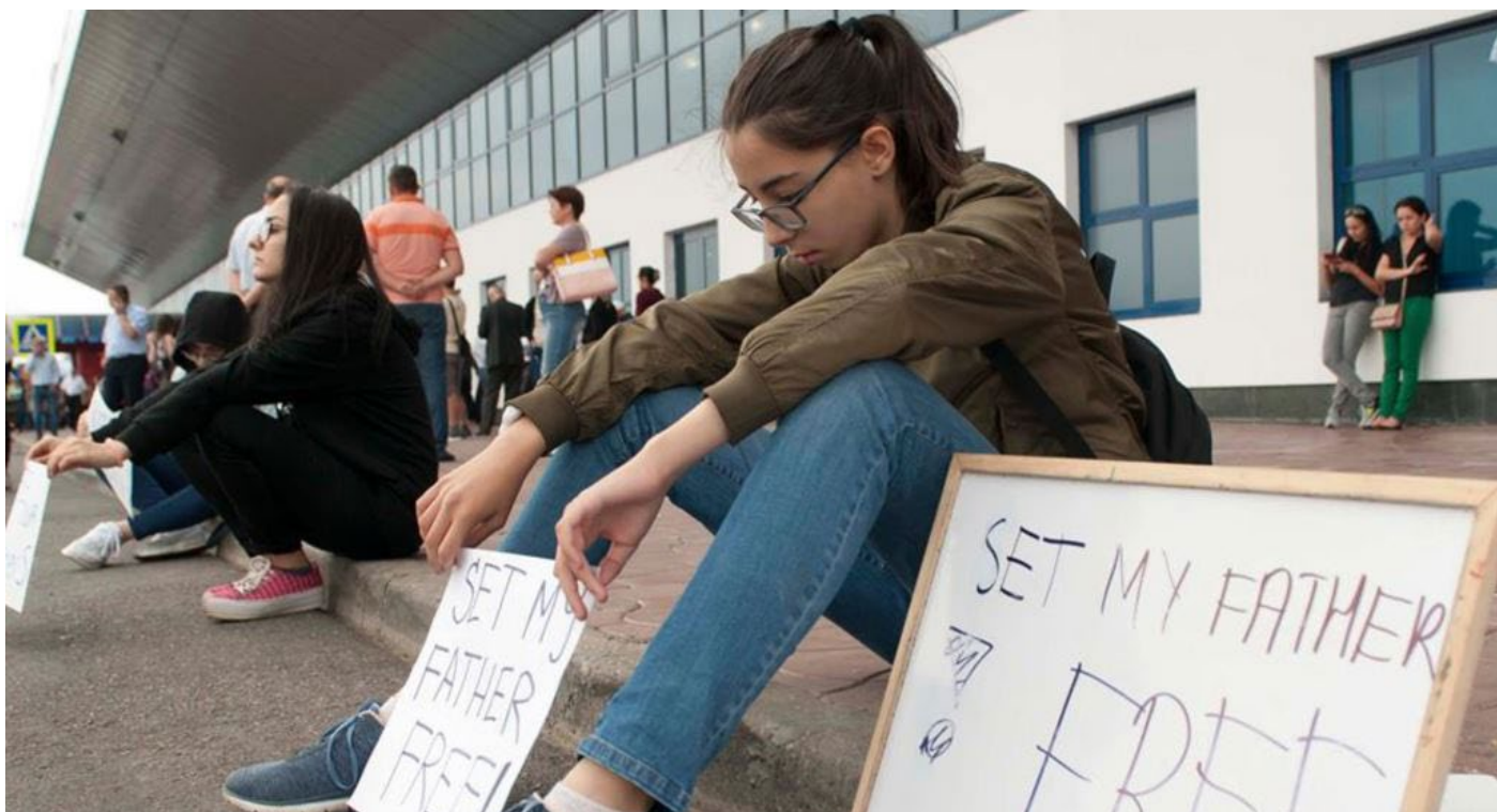
Родственники депортированных из Молдовы турецких граждан в аэропорту Кишинева.

Вновь возникли сомнения в необратимости европейского пути Молдовы, несмотря на постоянные заявления правящей коалиции в том, что Молдова останется преданной выполнению положений Соглашения об ассоциации. Промолдавская политика, проводимая как Демократической партией, так и администрацией президента, вызывает обеспокоенность в связи с будущими парламентскими выборами и возможными коалициями после них. Нарушения обязательств в Зоне Безопасности Оперативной группой российских войск (ОГРВ) остается на повестке дня Приднестровского соглашения, впрочем как и отсутствие общепринятой политики среди государственных институтов.