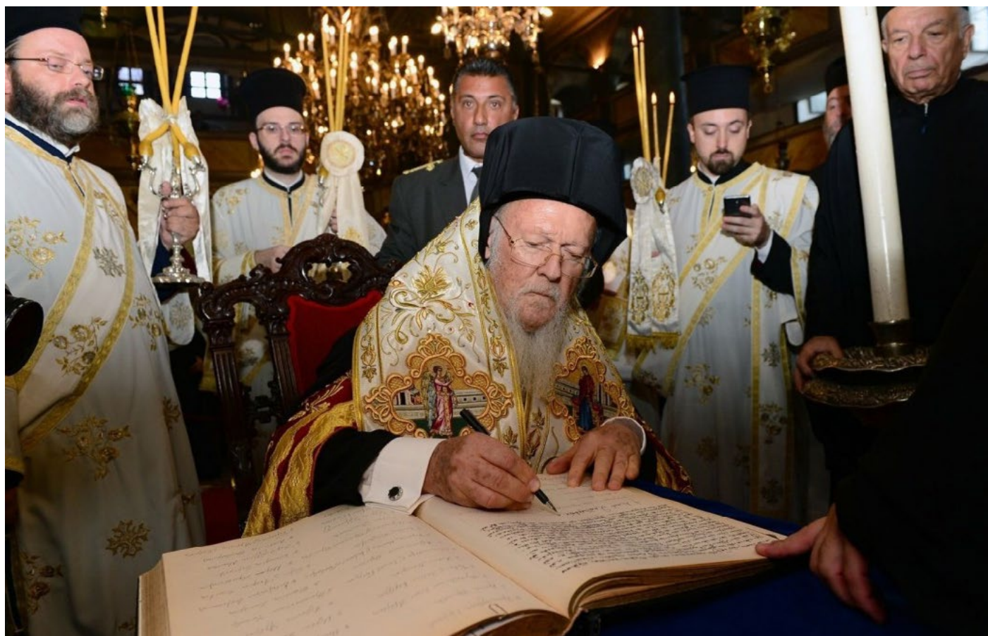
Вселенский патриархат начал процедуру подготовки к предоставлению Православной церкви в Украине автокефалии.

В сентябре движение Украины в направлении прочь от Москвы заметно усилилось. Прекращается действие двустороннего российско-украинского договора о дружбе, наметилась перспектива закрепления в Конституции Украины европейского вектора внешней политики, ослабевает сила Московского патриархата. В какой-то степени триггером данных процессов стало начало неофициальной избирательной кампании. Вместе с тем движение происходит с препятствиями: выводы МВФ о реформах в Украине неоднозначны, а в украинско-венгерских отношениях – очередное обострение.