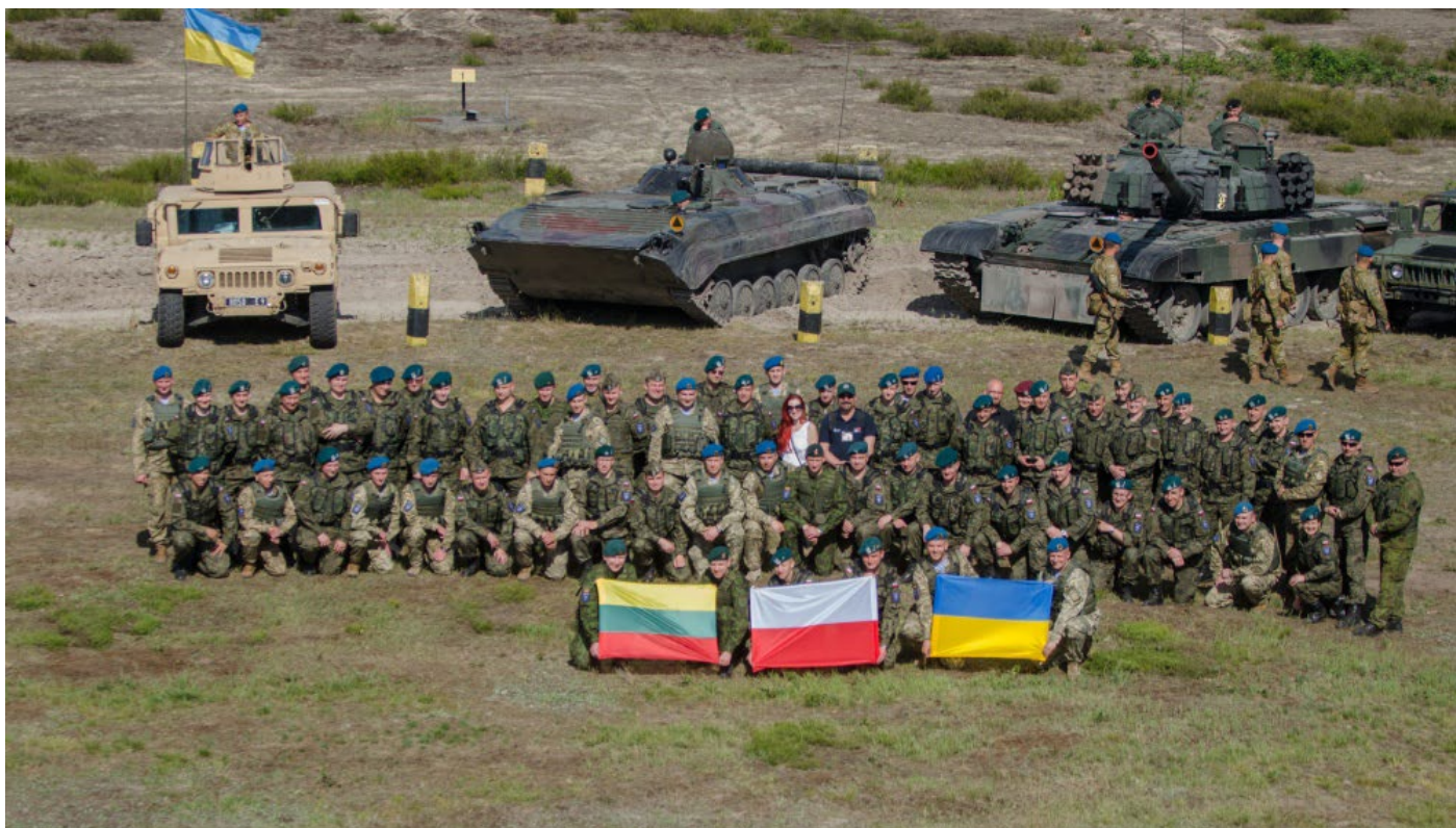
Украинско-литовско-польская бригада – удачный пример участия Украины в боевых тактических группах ЕС.

Европейский Союз четко определил направления в сфере безопасности, по которым он готов развивать сотрудничество со странами Восточного партнерства. Но открытым остается вопрос, насколько они являются приоритетными для стабильности и безопасности в регионе и в государствах-партнерах.