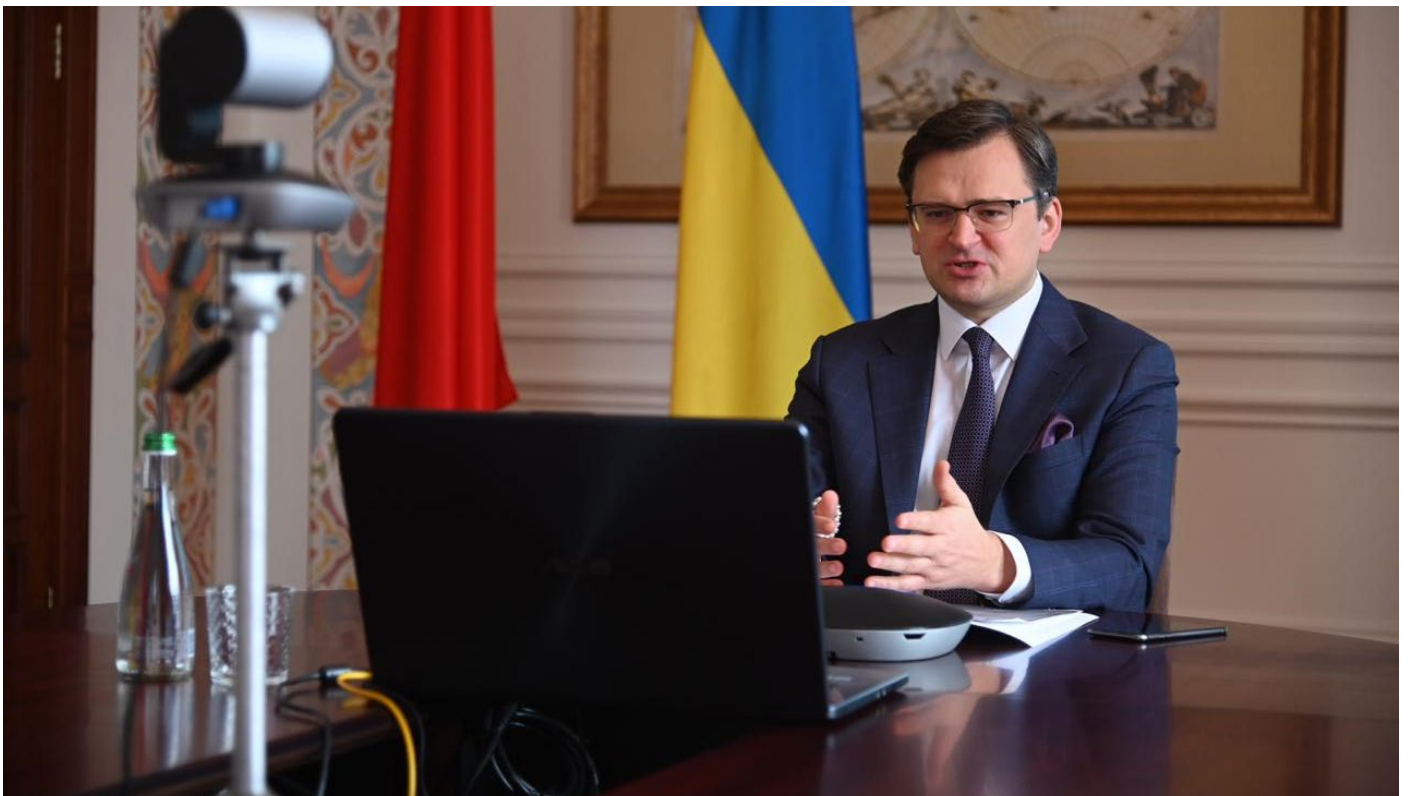
Из-за пандемии международные переговоры министр иностранных дел Украины Дмитрий Кулеба проводит в режиме видеоконференции.

Коронавирус и сопутствующий ему экономический кризис всё сильнее сказывается на украинской политике и экономике. На фоне дефицита ресурсов обостряется борьба между политическими группировками. Усиливается противостояние между миллиардерами Ринатом Ахметовым и Игорем Коломойским. Критически необходимой становится финансовая помощь Запада. Вместе с тем если в вопросах безопасности и политической поддержки Вашингтон и Брюссель солидарно поддерживают Киев, то в экономической сфере ставят условия. Реформы и прозрачность должны стать гарантией того, что макроэкономическая помощь не уйдет в карманы украинских олигархов.