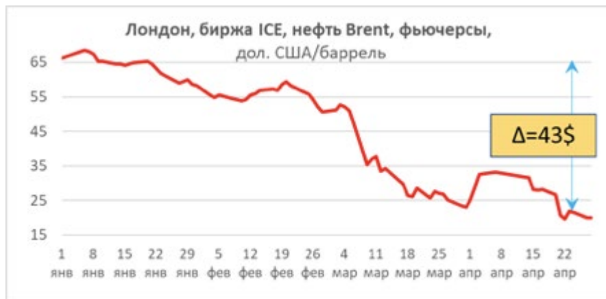
Рис. Лондонская биржа /2020/динамика цен на нефть.

Кризис нефтяного рынка стал следствием многих процессов. Количественно нефти на рынке становилось всё больше, прежде всего из-за роста добычи в США. В конце 2019-го США ежедневно добывали больше нефти, чем Саудовская Аравия и Россия. США стали мировым экспортером нефти и газа, оставив импорт на минимальном уровне.