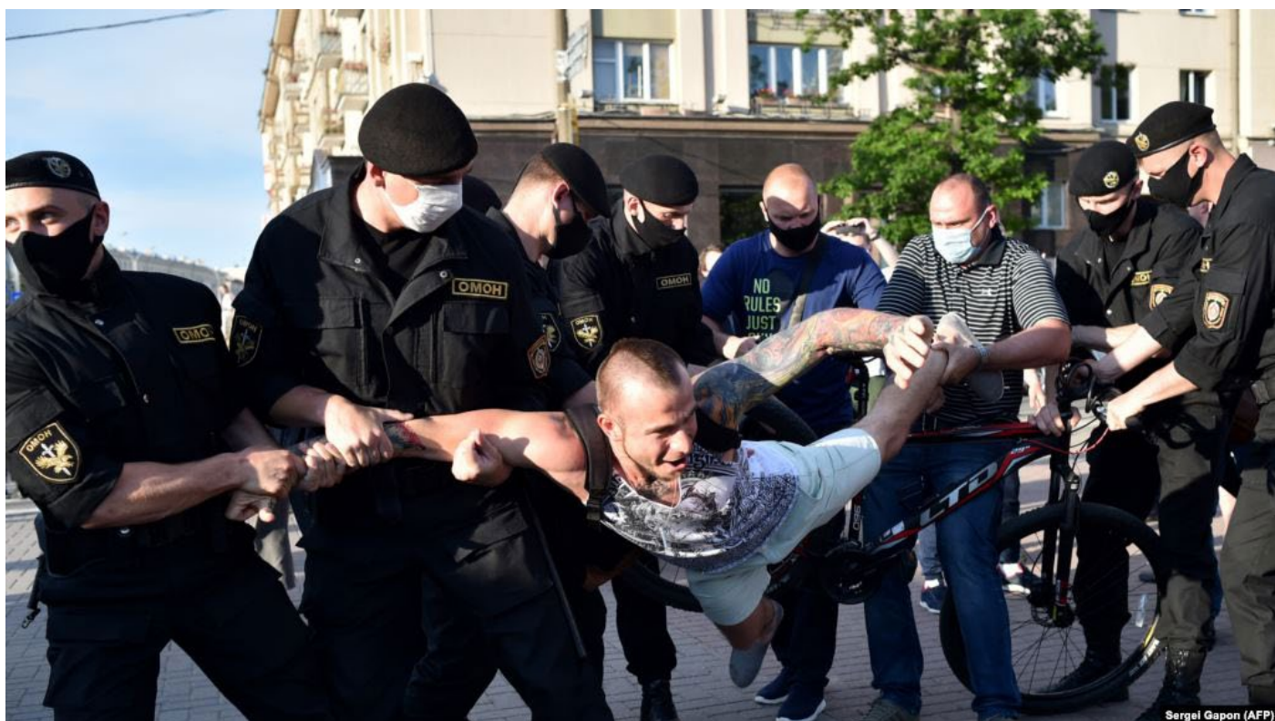
Фото: Задержание участника оппозиционной акции в Минске. 19 июня 2020 года.

Арестованы и оштрафованы сотни людей, Запад критикует преследование политиков и блоггеров. В новом правительстве силовики сменили рыночников.