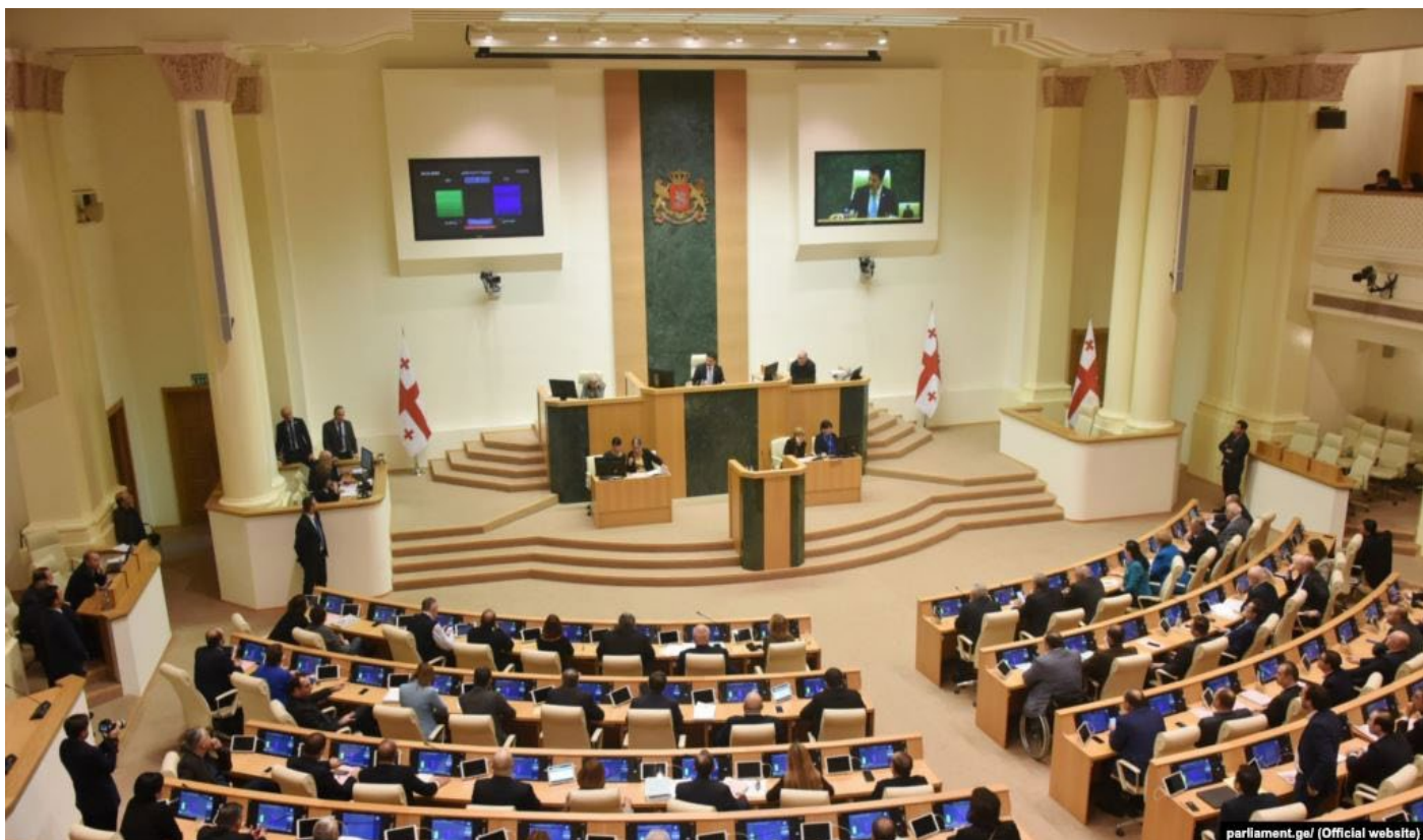
Фото: Голосование в парламенте Грузии

Парламенту наконец-то удалось принять долгожданные поправки к Конституции и установить новые правила игры для предстоящих парламентских выборов. Тем временем Грузия стала одной из немногих стран, граждане которых могут въезжать в ЕС.