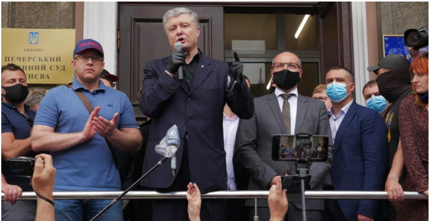
Фото: Пятому президенту Украины Петру Порошенко выдвинуты подозрения по нескольким делам.

Лето принесло Украине не только долгожданное тепло, но и довольно жаркие события. На внутривнутриполитическом фронте провалена программа правительства, продлен до конца июля адаптивный карантин и начались преследования оппозиционных политиков. В экономической сфере – позитивное решение МВФ, а вместе с ним и других международных финансовых институций по вопросам кредитов. А на внешнеполитической арене – заявления Президента В. Зеленского об амбиции получить полноправное членство в ЕС для Украины, а также прогресс в отношениях с НАТО.