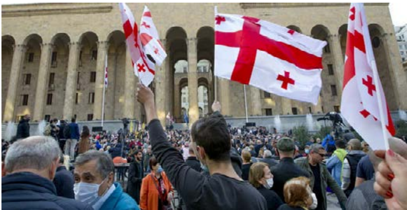
Акция протеста оппозиции у здания парламента Грузии в Тбилиси

Лаша ТУГУШИ, Либеральная академия Тбилиси (Грузия).