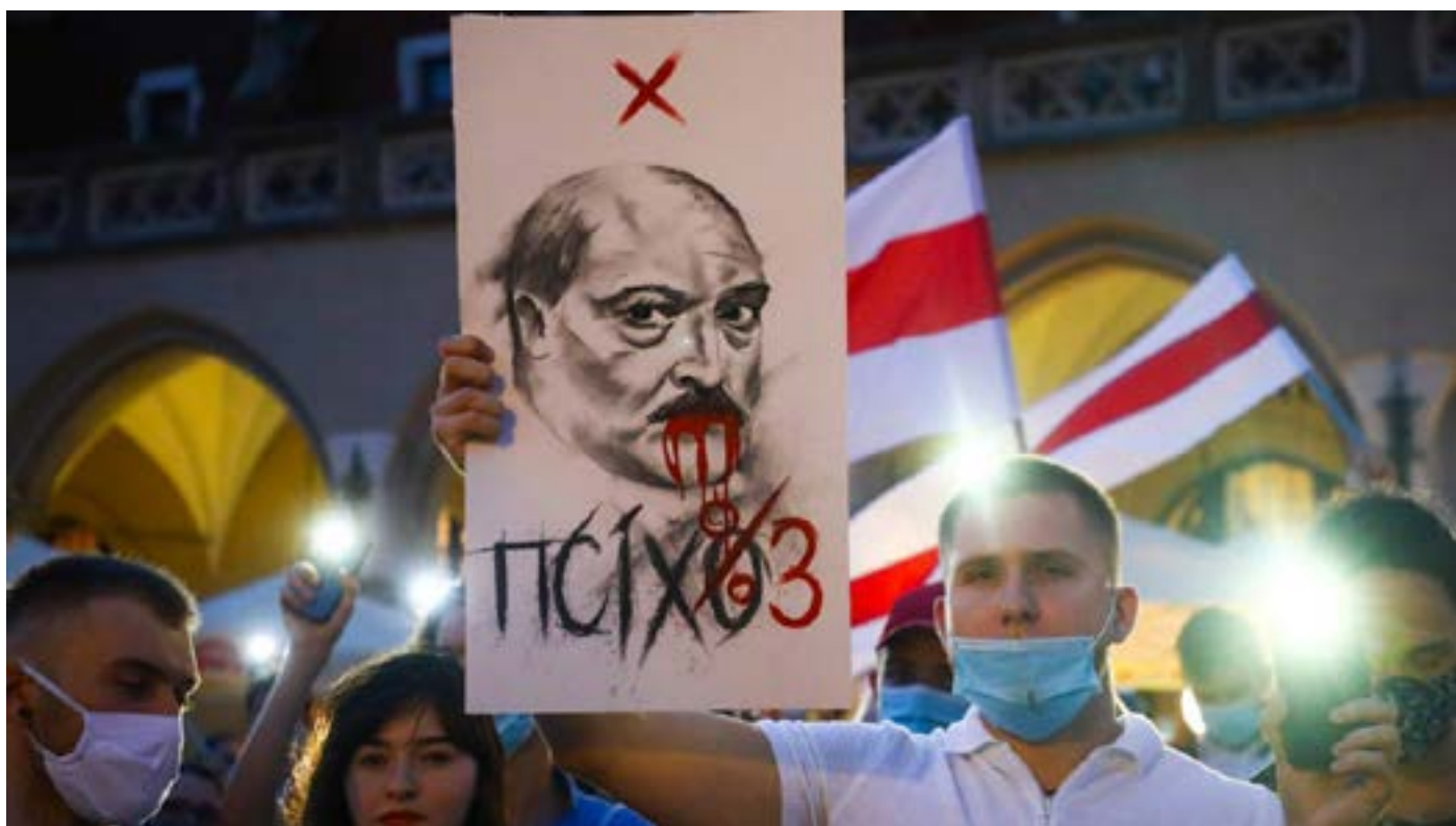
Протесты в Беларуси

Лукашенко стремится подменить протестную повестку обсуждением поправок к Конституции, Тихановская выдвигает ультиматум, европейские послы покидают Минск.