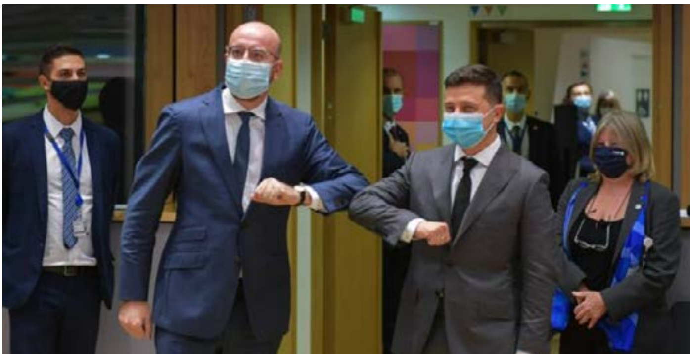
22-й Саммит “Украина-ЕС”

Если внутри Украины октябрь отметился некоторой политической турбулентностью, то на международной арене ситуация была достаточно стабильной, если не благоприятной. Похоже, Европа не так устала от Украины, как этого хотели бы в Москве. Однако не до конца ясно, насколько политические события октября, многие из которых будут иметь «долгоиграющий эффект», скажутся на последующем развитии страны. Ведь монобольшинству команды Зеленского, кажется, пришел конец, в стране – конституционный кризис, а поддержка партнеров не безгранична.