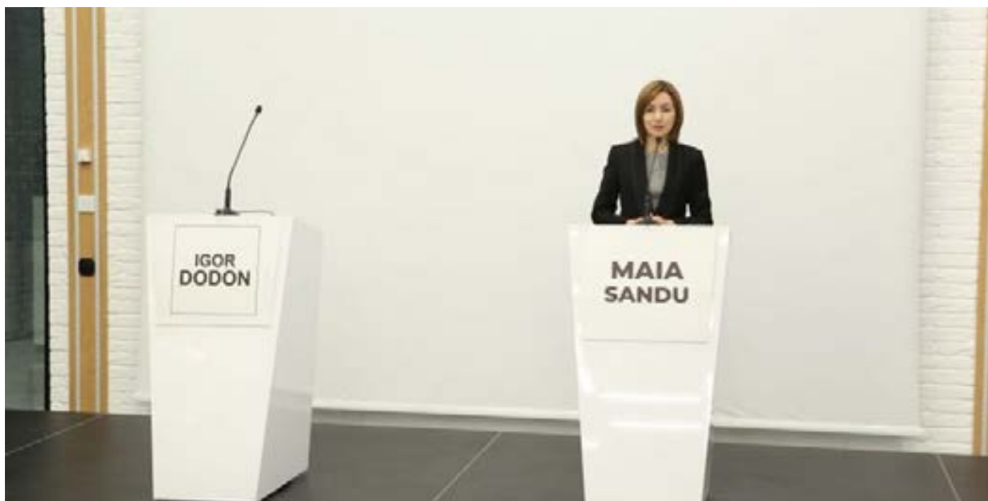
Игорь Додон не пришел на дебаты по приглашению Майи Санду.

Октябрь в Республике Молдова ознаменовался прежде всего ожиданием президентских выборов, которые назначены на 1 ноября, а также официальным стартом предвыборной гонки, в то время как остальные инфоповоды отошли на второй план либо были использованы для пиарходов кандидатов. И без того невысокий уровень предвыборной риторики упал еще ниже: зарегистрированные участники процесса перешли на циничные насмешки и упреки в адрес друг друга.