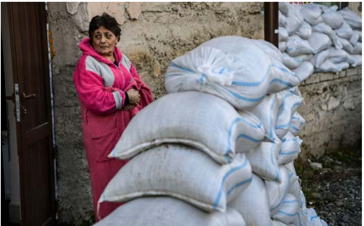
Женщина стоит в укрытие в Степанакерте.

Военные действия в Нагорном Карабахе продолжались в течение всего месяца и пока нет признаков их прекращения в обозримом будущем. С начала масштабной военной кампании Азербайджана во второй половине сентября Армения не без труда поддерживала оборону Карабаха дипломатическими инициативами, нацеленными на подписание мирного соглашения. В то же время атаки Азербайджана и захват территорий продолжались. Страна также столкнулась с новой волной роста случаев COVID-19, что угрожает и без того перегруженной системе национального здравоохранения.