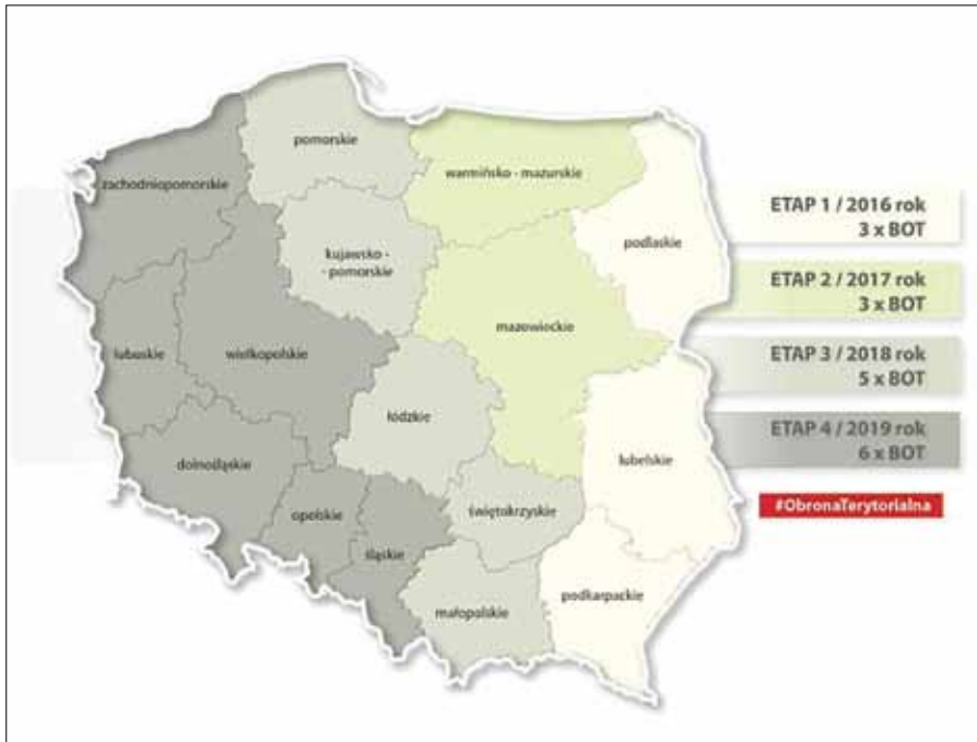
Рис.3. Етапи формування Військ територіальної оборони Польщі

повідної уповноваженої особи. Вже у квітні 2016 року була затверджена Концепція створення Територіальної оборони, а у листопаді того ж року парламент вніс необхідні зміни до закону про загальний військовий обов'язок та деяких інших законів, які були одразу схвалені президентом РП. Від 29 березня 2017 року Війська територіальної оборони розпочали повноцінну діяльність і мають до 2022 року сягнути чисельності 50 тис. осіб. У рамках I етапу формування ВТО три бригади були сформовані на сході Польщі — у Білостоці, Любліні і Жешуві. Згідно з планами Міністерства національної оборони РП, до 2019 року мають бути сформовані 17 бригад — по одній у кожному з 16 воеводств і дві в Мазовецькому, найбільшому воеводстві на сході країни.