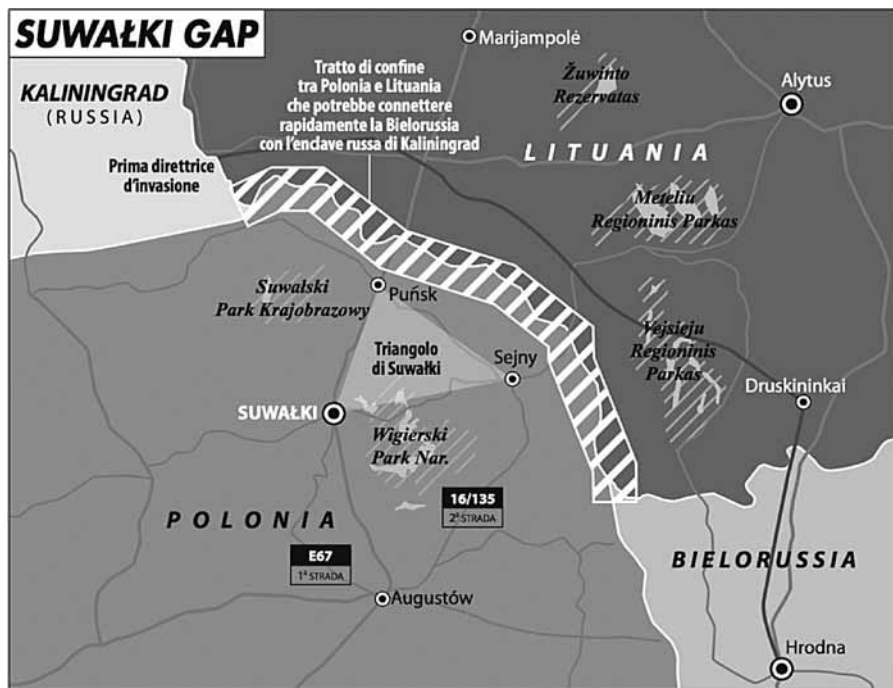
Рис. 4. Сувалцький коридор

Посилення оборонних спроможностей РП на сході спричинено серед іншого проблемою Сувалцького коридору – смуги вздовж польсько-литовського кордону довжиною близько 100 кілометрів, яка відділяє територію Білорусі від Калінінградської області РФ. Вважається, що Росія може вдатися до пробивання коридору задля суходільної ізоляції країн Балтії від решти країн-членів НАТО та ЄС, а також для створення додаткових оперативних-стратегічних переваг у військовій кампанії проти польських збройних сил та частин і підрозділів інших країн-членів НАТО, дислокованих у Польщі і Балтії.