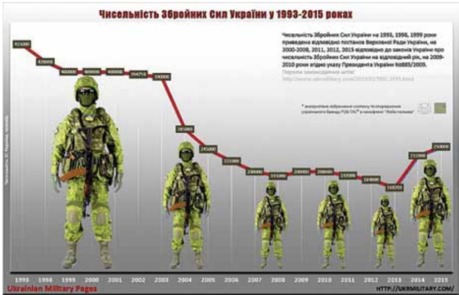
Рис.2. Чисельність Збройних Сил України