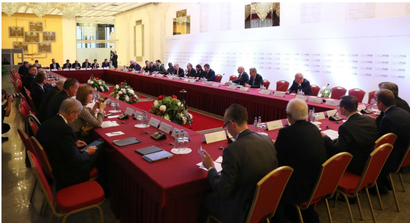
Встреча Основной группы Мюнхенской конференции по безопасности впервые прошла в Восточной Европе

30 октября – 1 ноября в Минске прошла встреча Основной группы Мюнхенской конференции по безопасности. Выбор места проведения – уже плохой знак для Восточной Европы. Да и результаты обсуждения показали: компромиссных решений для безопасности региона пока нет.