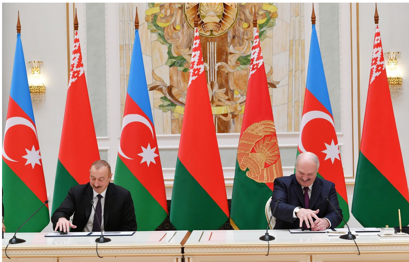
Азербайджан и Беларусь подписали 10 двусторонних соглашений.

В ноябре главными событиями внешнеполитической повестки дня стали визит президента Алиева в Беларусь и меморандум о приобретении военной техники и развитии военно-технического сотрудничества, подписанный между Беларусью и Азербайджаном. В то же время страна опустилась на четыре позиции в Индексе глобальной конкурентоспособности, который публикуется Всемирным экономическим форумом. Кабинет Министров в ноябре искал решения для проблем беженцев в стране.