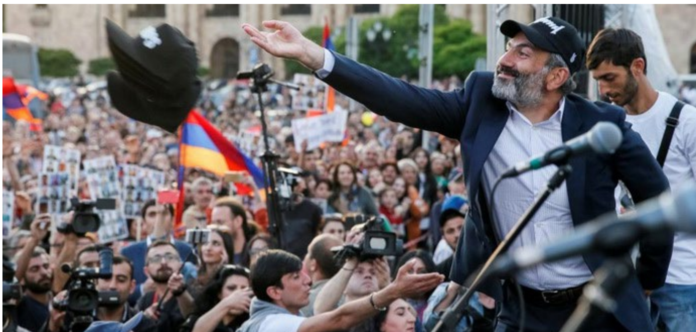
Убедительную победу на выборах одержит блок Никола Пашиняна «Мой шаг».

Внеочередные парламентские выборы, вокруг которых крутится жизнь в стране, обещают победу блоку премьер-министра. В экономике центральным стал вопрос реконструкции Армянской атомной электростанции и пролонгирование российского кредита на эти работы. В то время как в ОДКБ Армении пока не удалось сохранить за собой пост генерального секретаря.